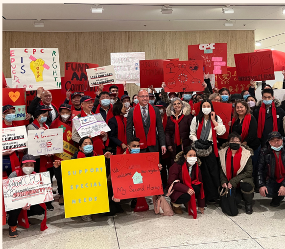
在 2 月 27 日于奥尔巴尼举行的华策会第五届年度纽约州倡议日活动中，倡导咨询委员会动员了 125 名员工和社区成员，呼吁制定一项投资于移民社区的预算。

多年来，我们的倡议日活动规模不断扩大，这与 倡导咨询委员会 成员的支持密不可分。倡导咨询委员会的成员负责协调交通、组织集会和带领会议。