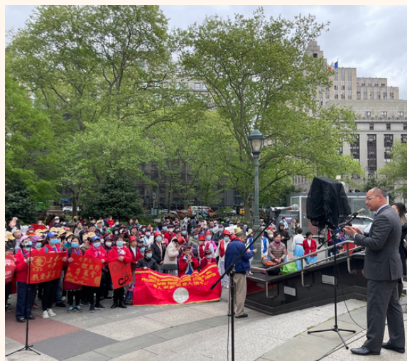
倡导咨询委员会动员了 500 多名社区人士参加华策会在福利广场举行的第六届年度纽约城市倡议日集会，要求市政府通过公平的预算。