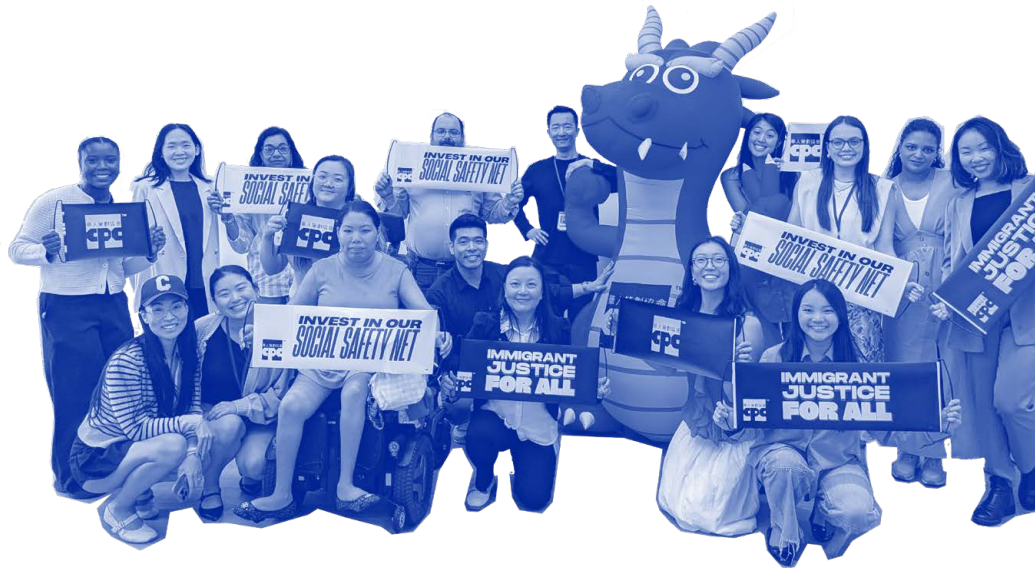
设计: 伍淑姿 (Stephanie Wu)

最后，也是最重要的，我们要感谢所有使这些焦点小组和讨论会得以顺利进行的CPC工作人员及社区成员。感谢你们的坦诚与真挚。